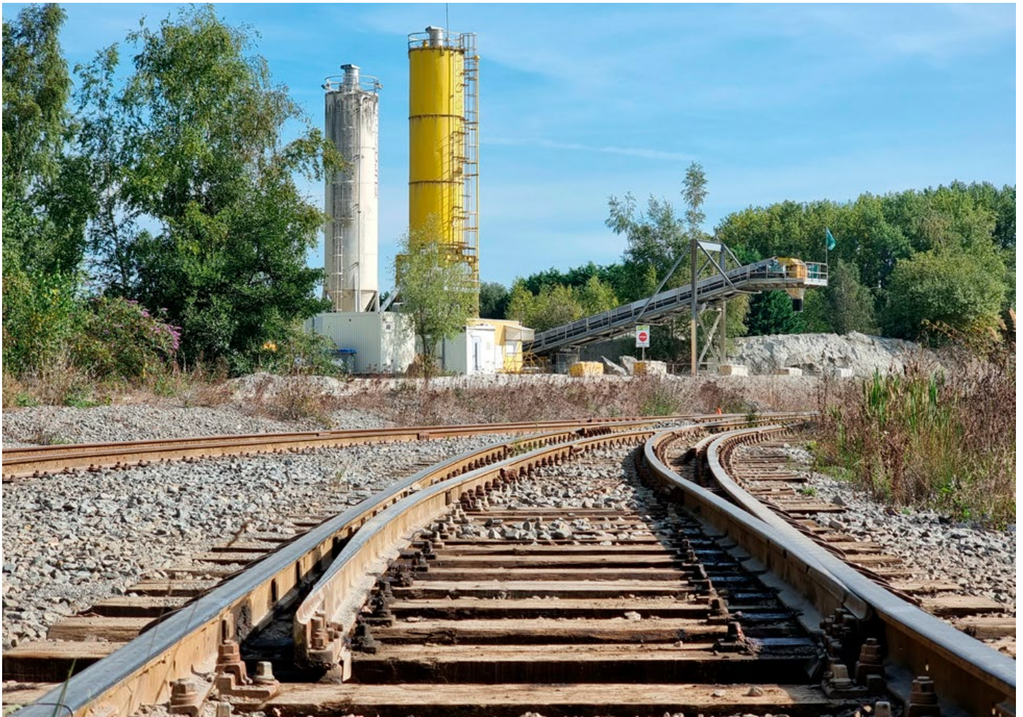
Carrières de Quenast